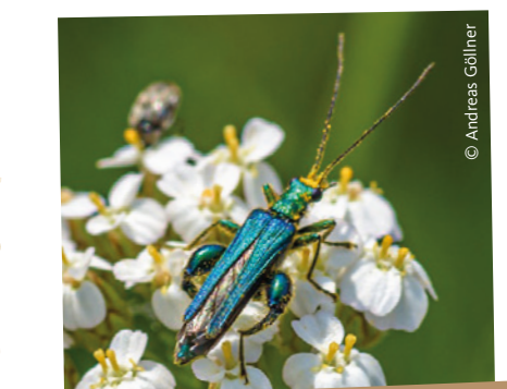
Dolden- und Korbblütler für Käfer und Schwebfliegen