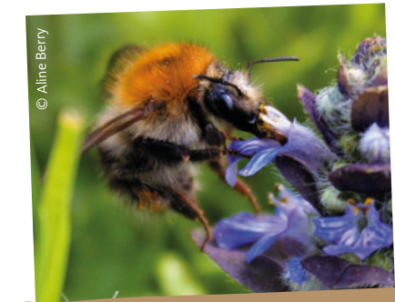
Lippenblütler für Solitärbienen und Hummeln